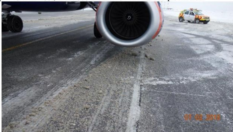
Пример некачественной очистки искусственных покрытий в аэропорту Шереметьево

наличие на ВПП и рулежных дорожках слякоти, а также необъективная информация о виде, площади и толщине слоя загрязнений.